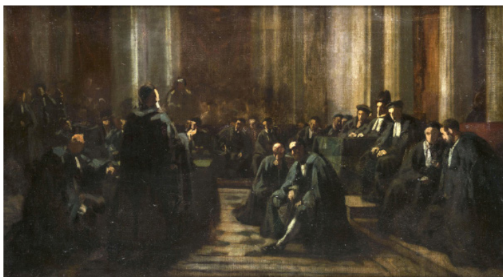
Le Grand Sanhédrin, 1867