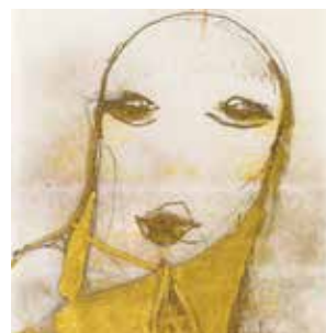
Marisa Merz (1926-2019), Sans titre, sans date, Paris, collection privée.