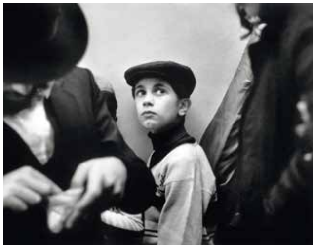
Genève, gare d'Aviation, Paris, 1981

Visite réservée aux Amis donateurs, bienfaiteurs et mécènes