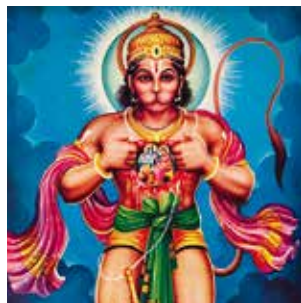
Hanuman portant Râma et Sita dans son cœur, fin des années 1970, Inde, Maharashtra, Mumbai, lithographie