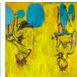
Georg Baselitz, « Die Mädchen von Olmo II », 1981

Plus d'informations: citedelarchitecture.fr