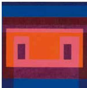
Josef Albers, Central Warm Colors Surrounded by 2 Blues , 1948 (détail), Josef Albers Museum Quadrat Bottrop