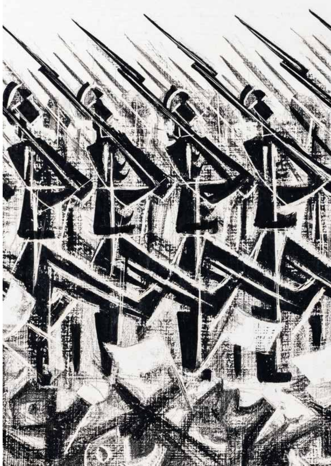
Si Lewen, Parade (détail) © IRSP

Engagé dans l'armée américaine, Si Lewen (Pologne, 1918 - États-Unis, 2016) débarque en 1944 dans une Europe qu'il a fuie une dizaine d'années plus tôt. Membre du Military Intelligence Service, il traverse de nouveau l'océan et le continent, et participe à la libération de Buchenwald, avant de retourner aux États-Unis, profondément éprouvé. Cette expérience est une des sources de Parade , qu'il achèvera en 1950, une suite saisissante de cinquante-cinq dessins en noir et blanc qui forme le récit à la fois réaliste et allégorique de la montée du nazisme, de la guerre, de la Shoah et de la réconciliation des peuples.