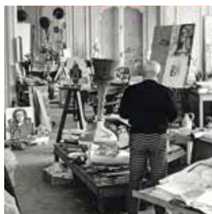
David Duncan Douglas, Pablo Picasso dans l'atelier de La Californie, Cannes, 1957, Musée national Picasso-Paris. © RMN Grand-Palais (Musée national Picasso Paris) / Image RMN-GP