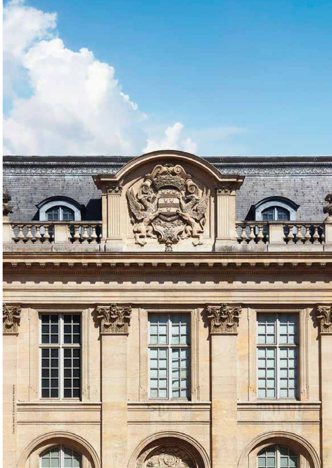
Cour du mahJ