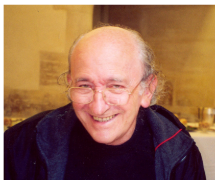
André Schwarz-Bart

En 1978, Saul Friedländer se penchait sur son enfance dans Quand vient le souvenir : un petit garçon juif, tchèque, enfant unique, devient à dix ans catholique, français et orphelin. Où mène le souvenir reprend le récit au moment où le premier s'arrête : en 1948, quand l'auteur, âgé de seize ans, fugue pour rejoindre clandestinement le jeune État d'Israël. Très vite s'établit une existence partagée entre trois mondes : l'Europe, les États-Unis et Israël, entre français, anglais et hébreu. Cette rencontre sera également l'occasion d'entendre Friedländer nous livrer ses réflexions sur le nazisme, tant sur les moyens de penser le génocide des juifs que d'écrire une histoire à la mesure du phénomène.