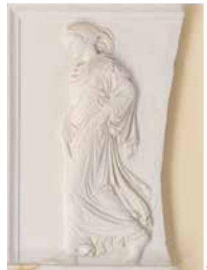
La Gradiiva moulage d'un bas-relief du musée du Vatican, Rome, copie romaine d'un marbre grec du IV e siècle. Exposée à l'occasion de « Sigmund Freud. Du regard à l'écoute ».