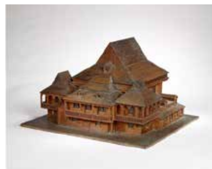
Maquette de la synagogue de Zabłudów (Pologne). Alger, ateliers de l'ORT, 1948-1950. Bois ciré et peint, verre. Don de l'ORT au musée d'Art juif.

Consulter notre programme et organiser votre événement mahJ.org