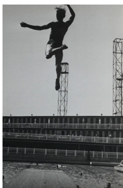
André Steiner Plongeon à la piscine Mollitor 1934 Paris, Centre Pompidou, MNAM-CCI, Dist. RMN- Grand Palais © Nicole Steiner-Bajolet © Martine Husson