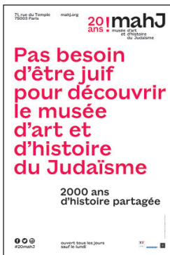
Campagne d'affichage conçue par l'agence Doc Levin pour les 20 ans du mahJ en 2018

Installé dans le cadre prestigieux de l'hôtel de Saint-Aignan, au cœur du Marais à Paris, le mahJ retrace l'histoire des juifs de France, d'Europe et de Méditerranée à travers la diversité de leurs formes d'expression artistique, de leur patrimoine et de leurs traditions, de l'Antiquité à nos jours. Proposant à un large public de découvrir l'ancrage très ancien des juifs dans la nation, ainsi que l'universalité de leurs productions artistiques et culturelles, le mahJ illustre deux mille ans de « cultures en partage ».