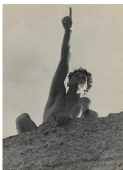
André Steiner 1933 Paris, Centre Pompidou, MNAM-CCI, Dist. RMN- Grand Palais © Nicole Steiner-Bajolet © Martine Husson