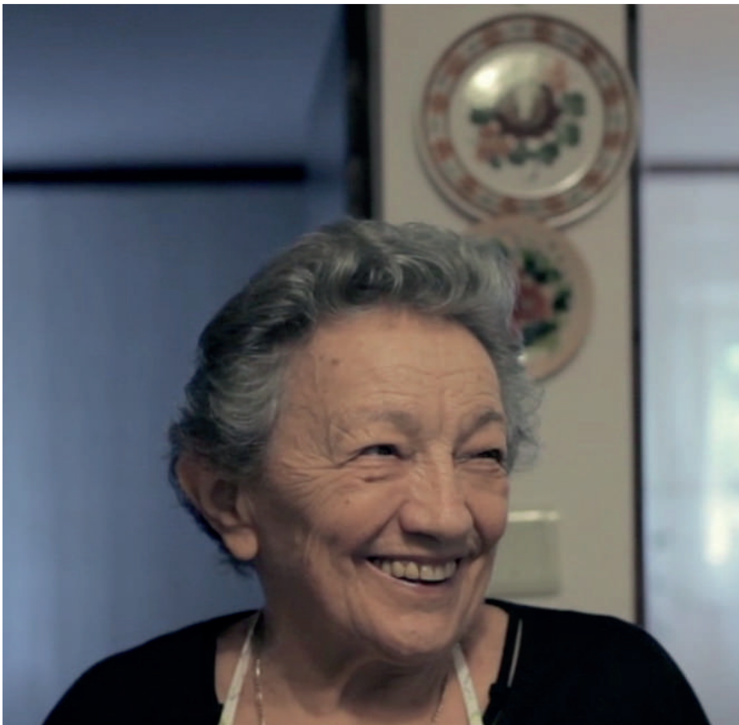
Grandmas Project - Knedle