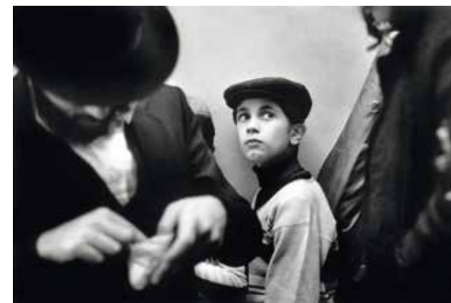
Soirée à l'occasion du trente-troisième anniversaire de l'État d'Israël, Salle Gaveau, Paris, mars 1981

Voir aussi, page 20, le parcours inter-musées « Destins d'artistes » avec le Mémorial de la Shoah