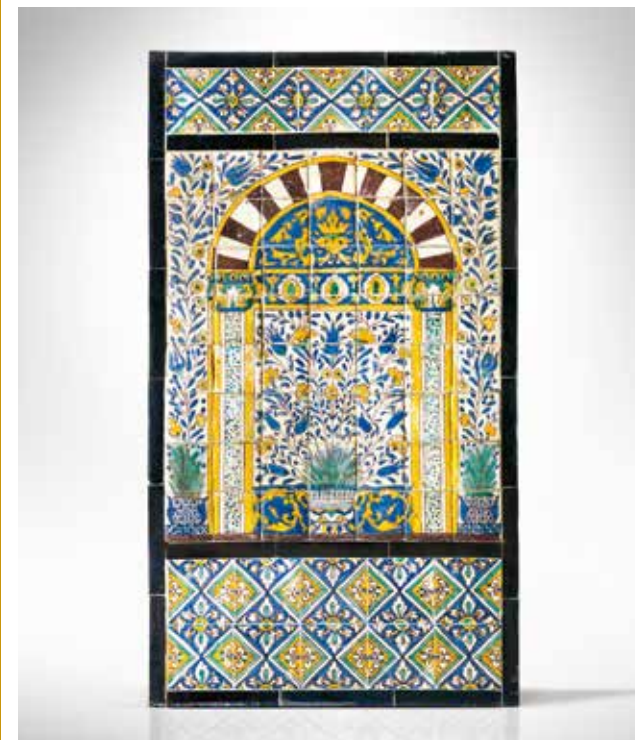
Panneau de revêtement mural, Tunis, atelier Chemia, Tunisie, vers 1920 mahJ © Giovanni Ricci-Novara

2 de séance: parcours-atelier «Parfums de Méditerranée» au mahJ (durée: 2h30), voir page 8