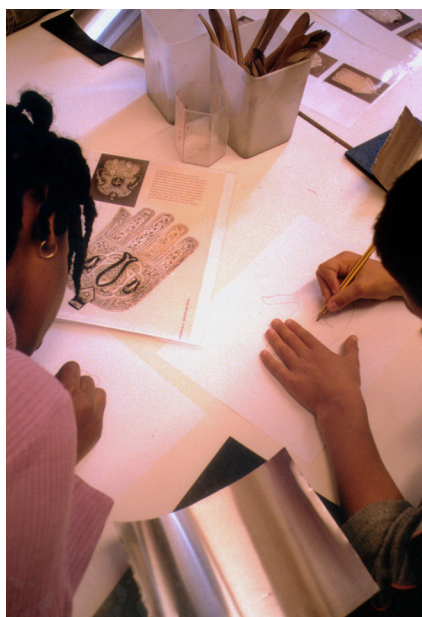
Atelier « Cultures en partage : juifs et musulmans »