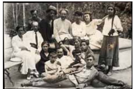
Artistes de la Kultur-Lige, Kiev, 1919