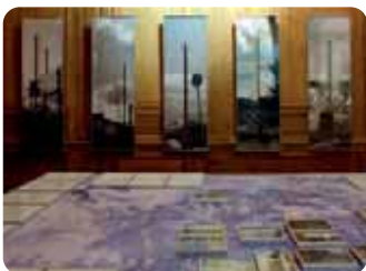
Sophie Calle, L'Erouv de Jérusalem, 1996 photographie © MAHJ © Adagp, Paris 2009

De brèves séquences de l'histoire de Jérusalem sont abordées dans les programmes d'histoire des classes de seconde et de terminale. Le MAHJ propose de revenir plus largement sur l'histoire complexe de cette ville qui a déchaîné les passions depuis l'Antiquité jusqu'à l'époque actuelle. Voyageant à travers les cartes (anciennes et contemporaines), les récits et les représentations symboliques de cette ville dans les trois monothéismes, le propos pourra illustrer la prégnance de ce thème dans l'histoire occidentale . En s'inspirant de L'Erouv (1996), œuvre de l'artiste contemporaine Sophie Calle, les élèves seront invités à réaliser une œuvre collective qui fera dialoguer une pluralité de Jérusalem(s), passées ou présentes, imaginées ou réelles.