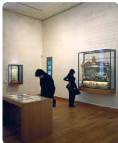
Salle d'introduction des collections permanentes du MAHJ